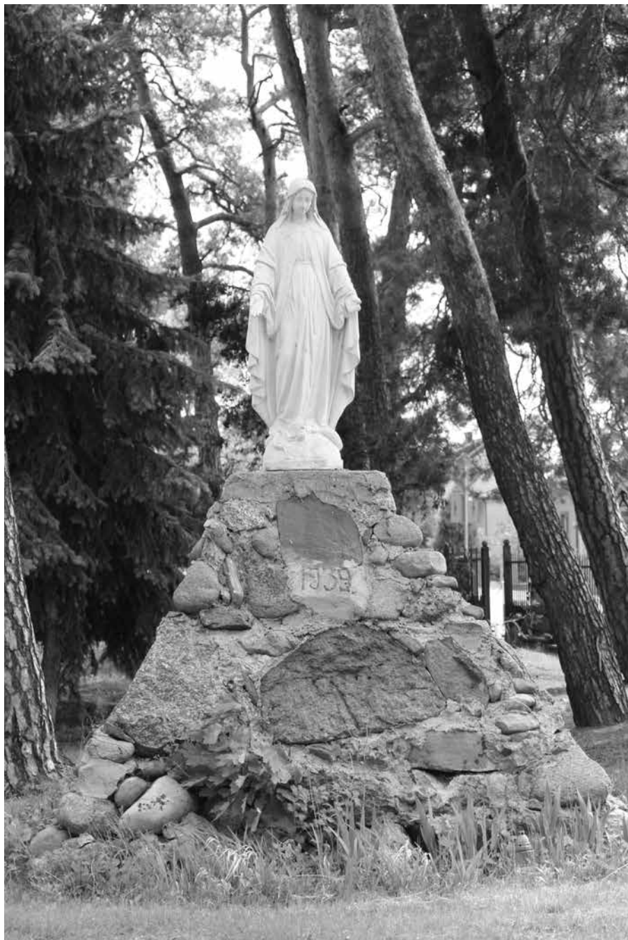
Kapliczka Matki Boskiej Niepokalanej w Borkach (1939 r.)