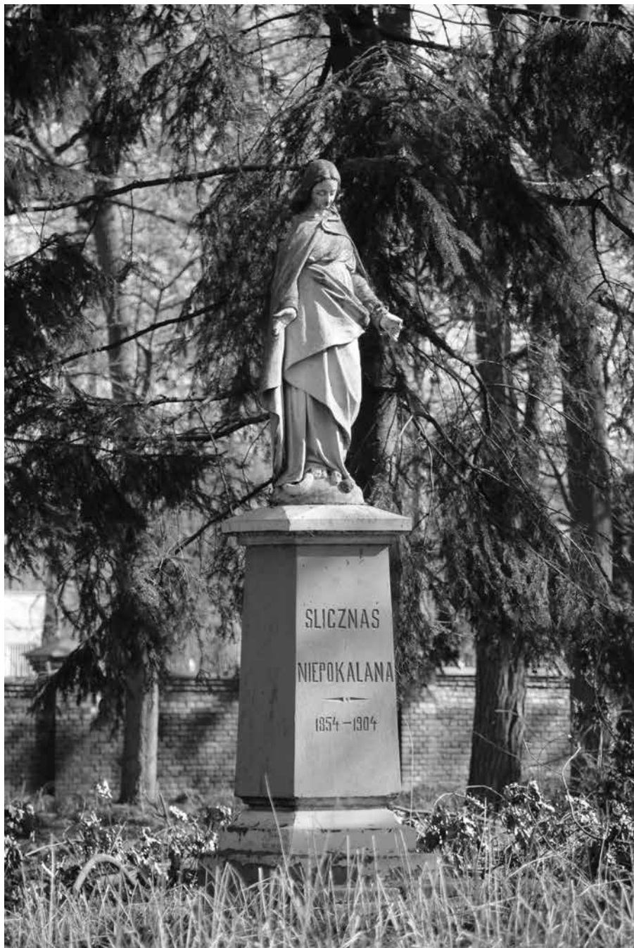
Figura Matki Bożej Niepokalanej przy pałacu „Gubernia” w Radzynie Podlaskim (1904 r.)