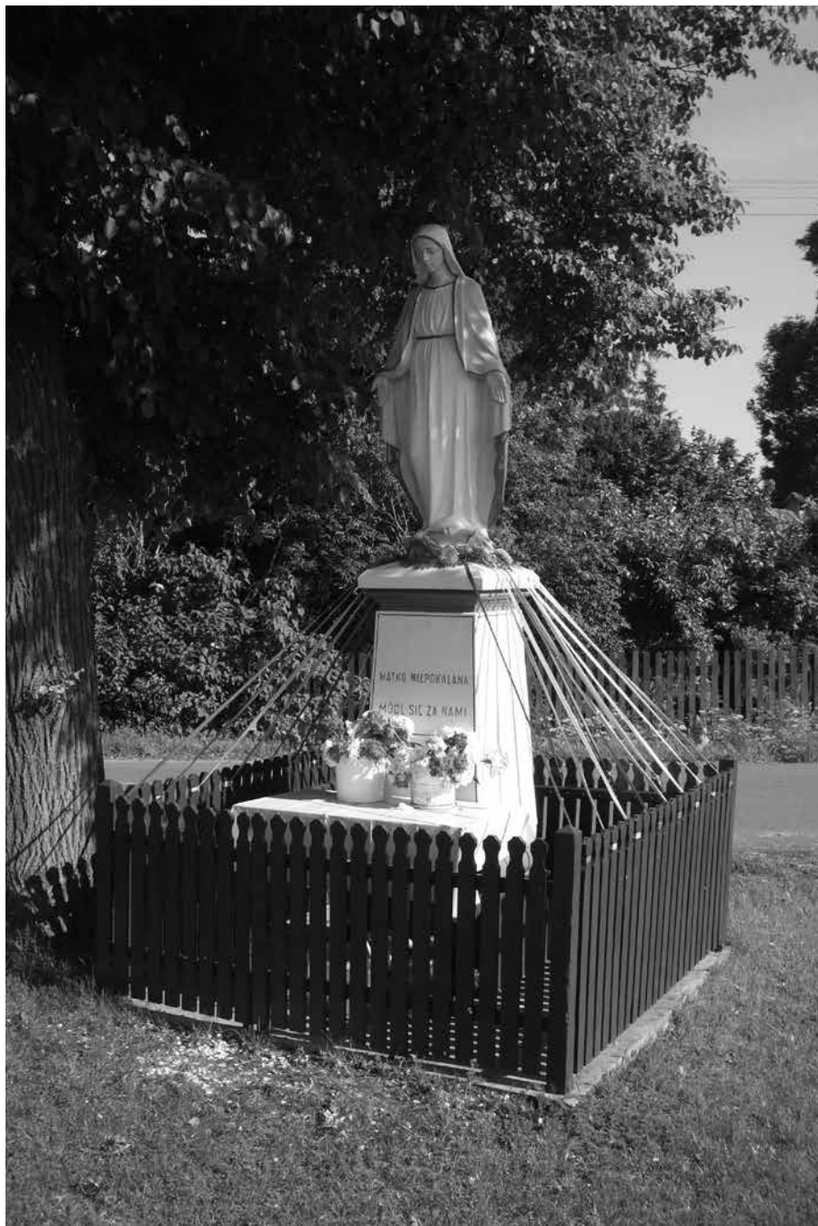
Figura Matki Bożej Niepokalanej w Branicy Radzyńskiej (1908 r.)