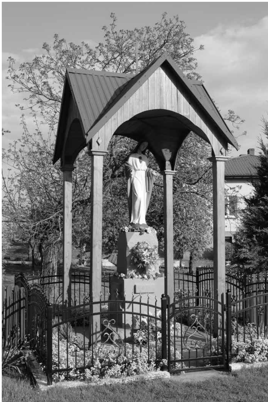
Kapliczka z figurą Matki Bożej Niepokalanej w miejscowości Sitno (1953 r.)