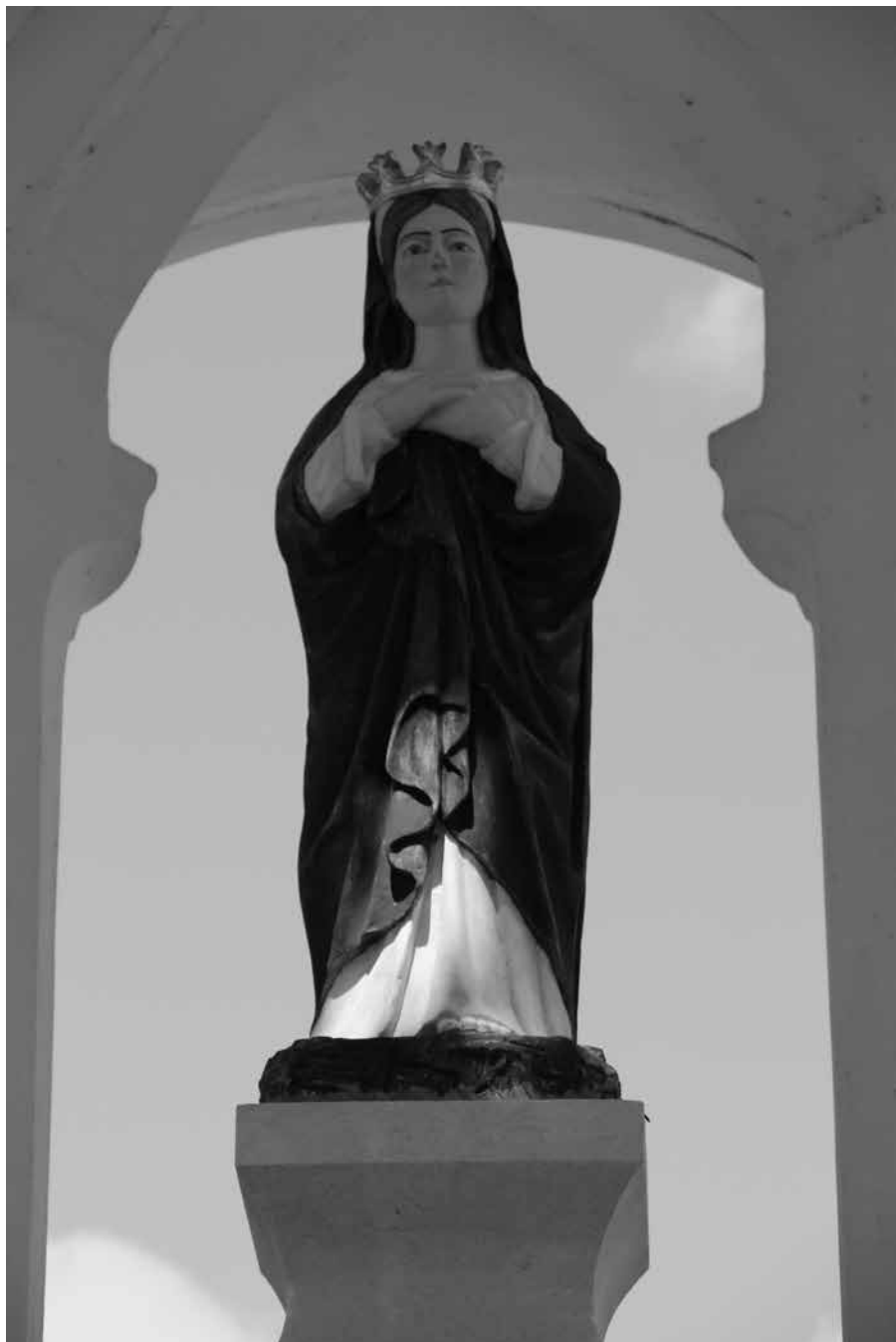
Figura Matki Bożej z kapliczki w centrum Czemiernik (XIX/XX w.)