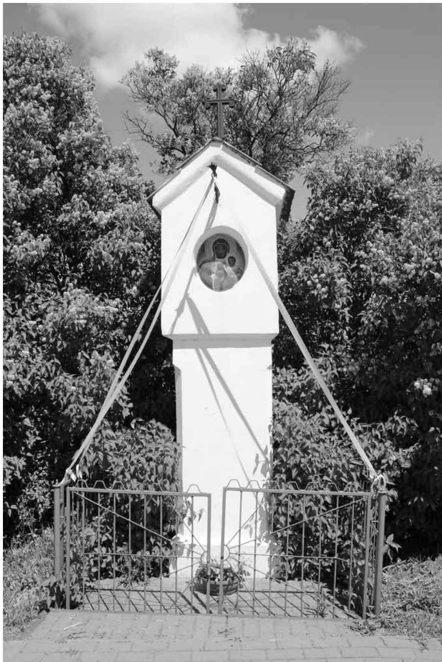
Kapliczka dworska z wizerunkiem Matki Boskiej Częstochowskiej w Woli Osowińskiej (pocz. XX w.)