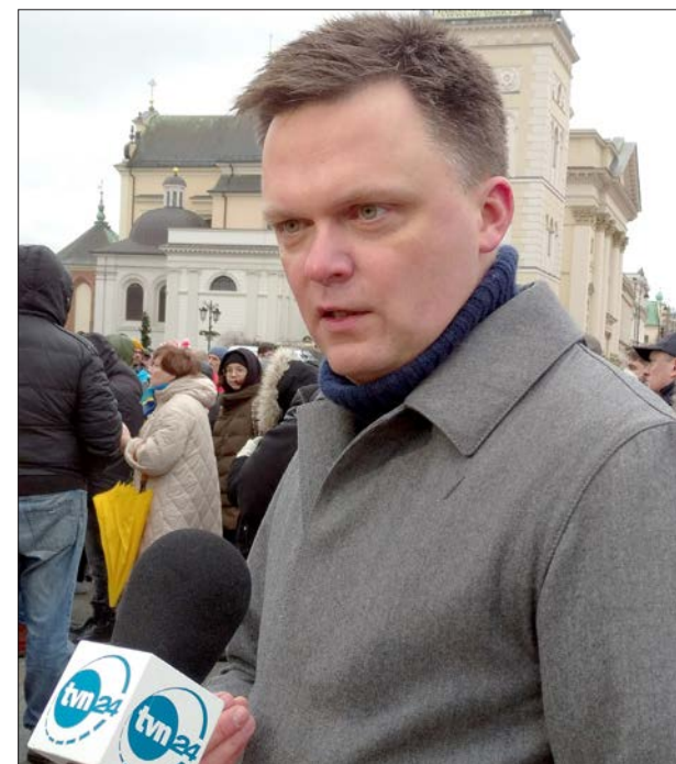
HS Lider Trzeciej Drogi Szymon Hołownia