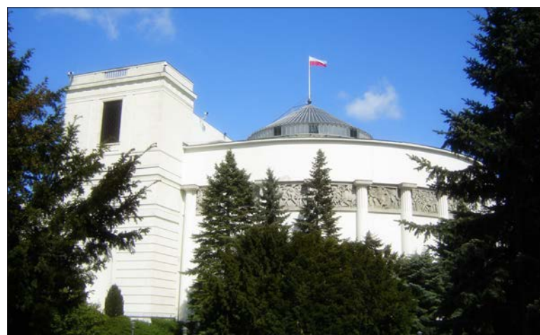
Gmach Sejmu i Senatu znajduje się w Warszawie przy ul. Wiejskiej 1