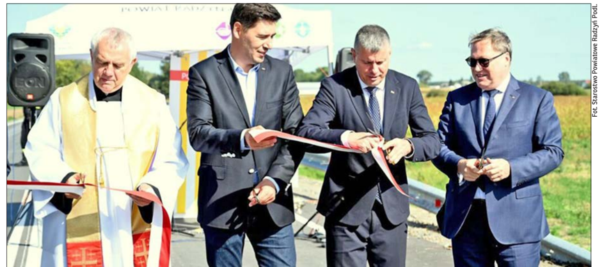
Most w Lisiowólce oficjalnie otwarty

Nowy most w Lisiowólce (gm. Wołyń) już otwarty! Było to możliwe dzięki wsparciu z rządowego funduszu Polski Ład, aktywności władz powiatu radzyńskiego ale także pięknej postawie mieszkańców, którzy bezpłatnie przekazali kawałek ziemi, na którym przeprowadzono niezbędne prace.