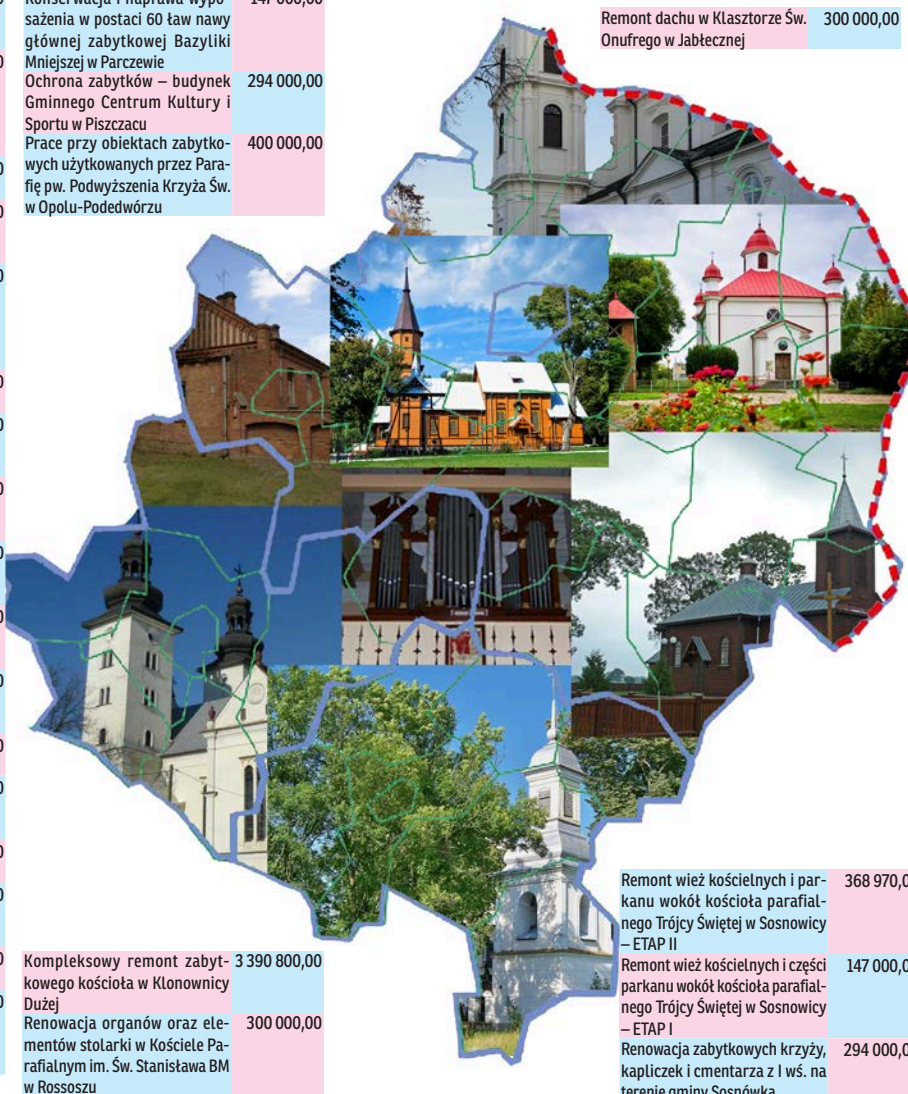
Remont dachu w Klasztorze Św. Onufrego w Jabłecznej 300 000,00