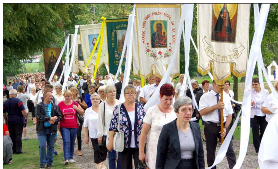
Katolik musi kierować się swoją wiarą także podczas wyborów

O ile obowiązkiem katolika jest udział w głosowaniu i oddanie głosu zgodnie z własnym sumieniem, o tyle w sytuacji, gdy społeczeństwo