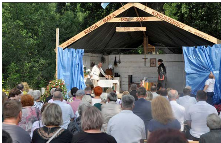
Projekcja filmu odbyła się w Kłodzie Małej

W minioną niedzielę w parafii Przemienienia Pańskiego w Horbowie oddano hołd zamordowanemu przez Rosjan unickim męczennikom za wiarę. Z tej okazji odbyła się tam uroczysta eucharystia, a mieszkańcy i pielgrzymi mogli obejrzeć film „Z ziemi podlaskiej. Modlitwa o Polskę”, poświęcony ofiarom rosyjskich zbrodni. Projekcja filmu miała miejsce w pobliskiej Kłodzie Małej, gdzie dzieje się część wydarzeń przedstawionych przez reżysera. Dokument Michała Muzyczuka opowiadający o losach tysięcy unickich rodzin, które w drugiej połowie XIX wieku cierpiały na terenie dzisiejszego Podlasia Południowego męki ze strony ówczesnej carskiej administracji, to przejmująca opowieść o losach polskich rodzin, które nawet pod łufami carskich oficerów nie chciały