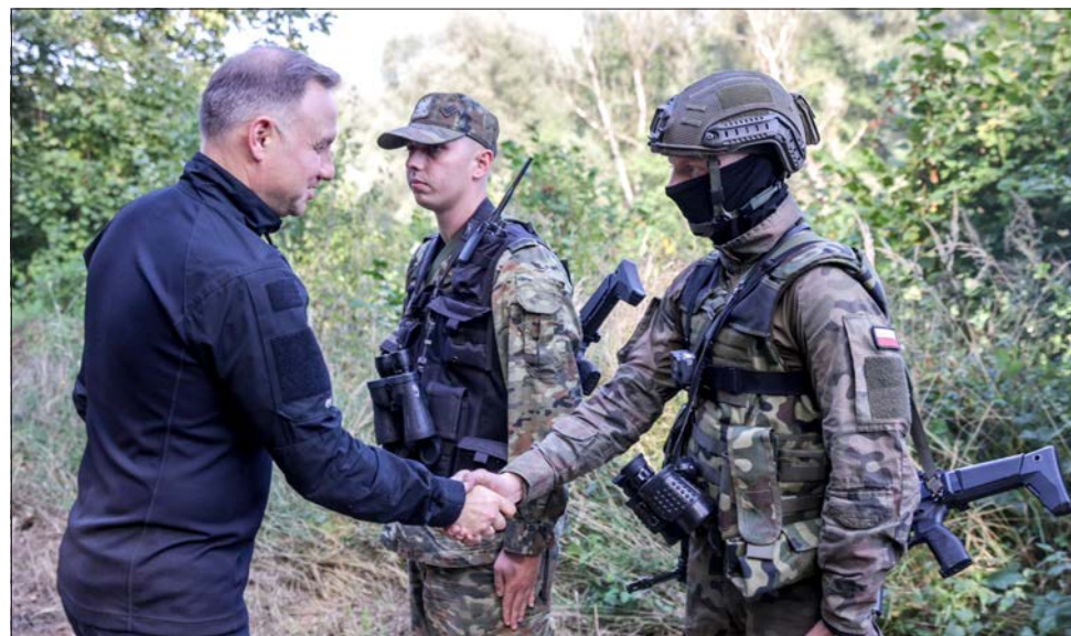
Andrzej Duda spotkał się z żołnierzami i strażnikami granicznymi z NOSG