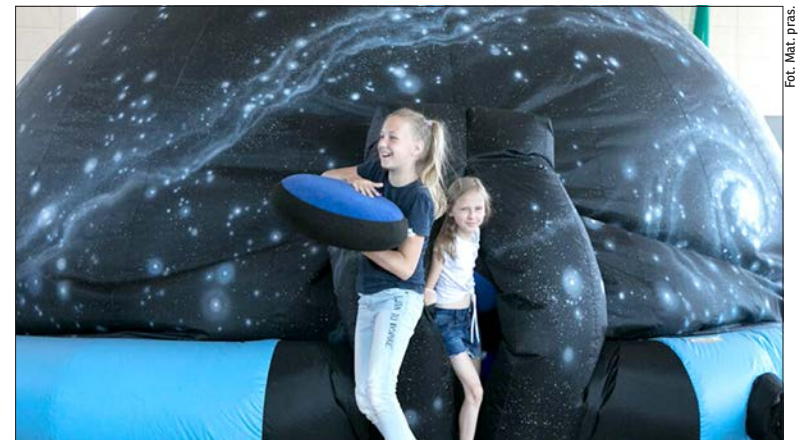
Astronomia to przede wszystkim doskonała zabawa

By poczuć się jak astronom, wystarczy podnieść głowę i spojrzeć w niebo. Jak wyglądają najbardziej znane gwiazdozbiory? Gdzie ich szukać? Czy warto? Jest okazja, by się przekonać! Planetobus z Centrum Nauki Kopernik z mobilnym planetarium na pokładzie przemierza Polskę wzdłuż, by spotkać się z uczniami. I tak 2 i 3 października pojawi się w Publicznej Szkole Podstawowej im. Św. Jana Pawła II w Tuliłowie w powiecie białskim. Ekipa Planetobusu przekonuje, że astronomia to fascynująca i łatwo dostępna dziedzina nauki. Do obserwacji nieba nie jest potrzebny jest specjalistyczny sprzęt. Wystarczy w bezchmurny wieczór wybrać się w ciemne miejsce, spojrzeć w górę i skupić wzrok. Pomocne są także specjalne