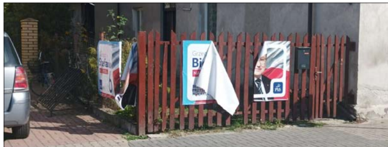
Kobieta, prawdopodobnie zwolenniczka opozycji, tak walczyła z bannerami, że nie zauważyła kamery monitoringu

14 banerów wyborczych z wizerunkami senatora Grzegorza Biereckiego i posła Dariusza Stefaniuka ubiegających się o głosy mieszkańców Białej Podlaskiej zostało zniszczonych przez jedną z mieszkanki miasta.